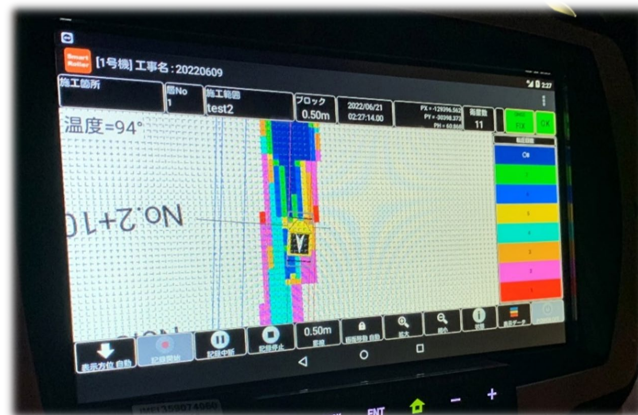
転圧温度管理モニター