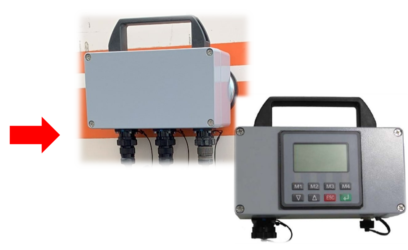
MDIインターフェース