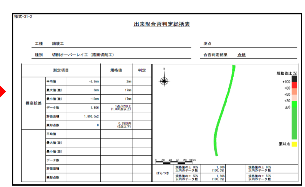
出来形管理図(ヒートマップ)作成