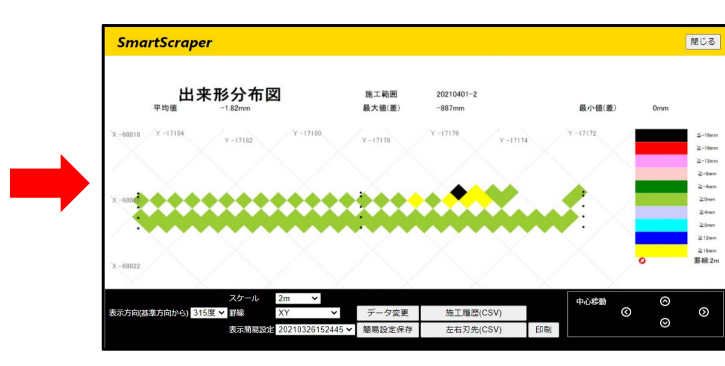
web画面で出来形管理図