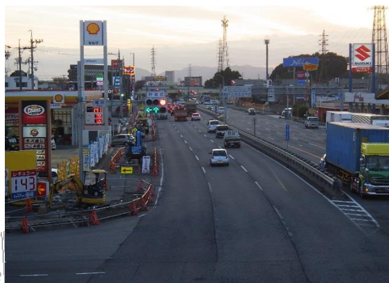
国道1号下り線 庵原交差点より